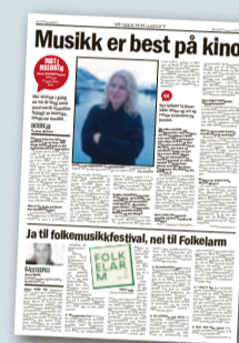
Musikkmagasinet 20. januar